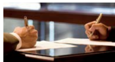
Oft werden Familienverfassungen aufgesetzt, um die Werte des Unternehmens über Generationen festzuhalten.

Es bleibt abzuwarten, welche Auswirkungen diese und weitere Erkenntnisse auf die Erfolgsgeschichte der Familienverfassung haben werden. Wird sie als „scharfes Schwert“ noch stärker dazu beitragen können, Streitigkeiten in Familienunternehmen zu vermeiden? Es lohnt sich, dies empirisch weiter zu ergründen und juristisch zu begleiten.