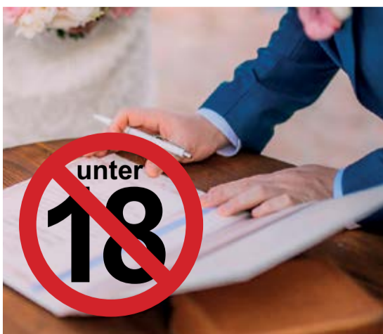
Auch für im Ausland geschlossene Ehen gelten künftig die in Deutschland festgelegten Altersgrenzen.

Weitere Informationen zum Thema, wie ein Interview mit Institutsdirektor Prof. Jürgen Basedow, finden Sie unter: www.mpipriv.de