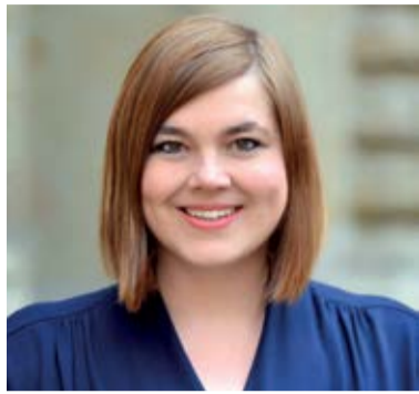
Katharina Fegebank, Zweite Bürgermeisterin und Senatorin in der Behörde für Wissenschaft, Forschung und Gleichstellung

Gastbeitrag der Wissenschaftssenatorin und Mitglied des Kuratoriums Katharina Fegebank über eine sichtbare Wissenschaft in Hamburg