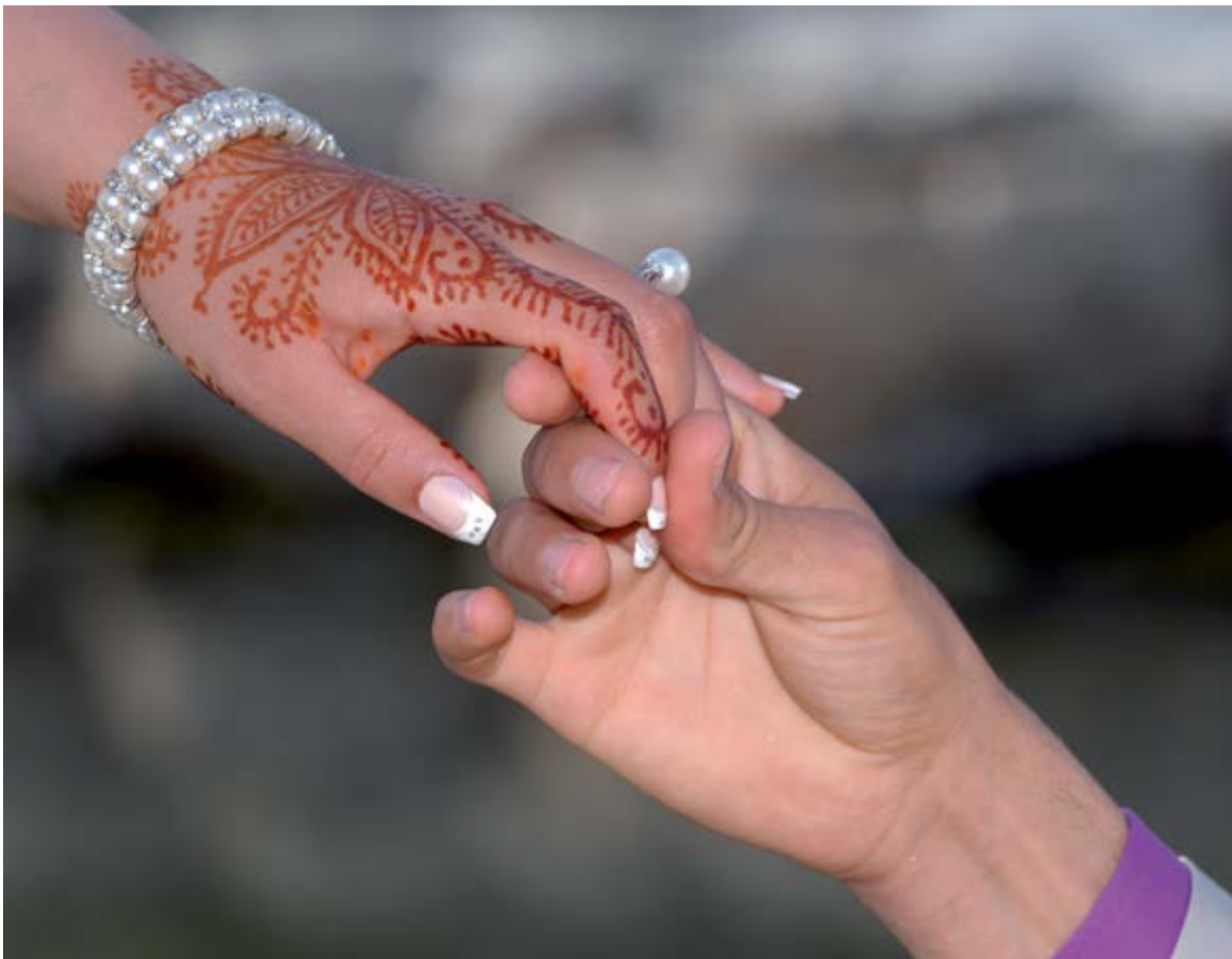
Anders als die bisherige Einzelfallprüfung lässt der Gesetzentwurf zur Bekämpfung von Kinderhehen wenig Spielraum für Lebensumstände, kulturelle Prägungen und persönliche Lebenswege der Betroffenen.