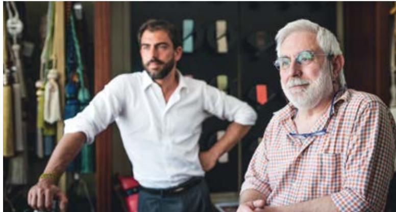
Übernimmt die nächste Generation das Ruder im Unternehmen, kann eine Familienverfassung Antworten auf potentielle Konfliktfragen geben.

„Untersucht man neben der deutschen Familienverfassung die Familiy